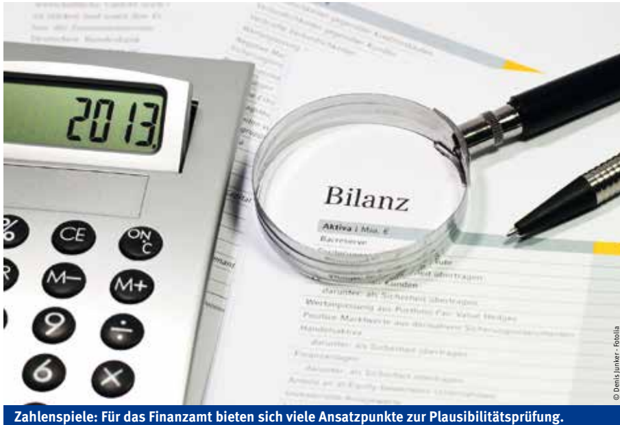
Zahlenspiele: Für das Finanzamt bieten sich viele Ansatzpunkte zur Plausibilitätsprüfung.

KANZLEI LANGER UND KOLLEGEN VEREIDIGTER BUCHPRÜFER · STEUERBERATER · RECHTSANWÄLTE INGOLSTADT · MÜNCHEN · LANDSHUT · ROSENHEIM